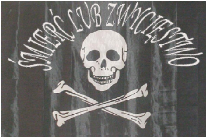
Sztandar żuawów pułku Dzieci Warszawy płk. L. Żychlińskiego, rekonstrukcja autora

z wyszytą srebrną nicią trupią głową, z piszczelami na krzyż i napisem: „Śmierć Lub Zwycięstwo”. Po bitwie pod Krynicią został ukryty z amunicją w lesie, w okolicy majątku Gołosze, jednak kozacy biciem zmusili fornali do wydania miejsca jego ukrycia.