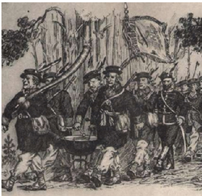
Kurpiowski sztandar powstańczy 1863 roku.