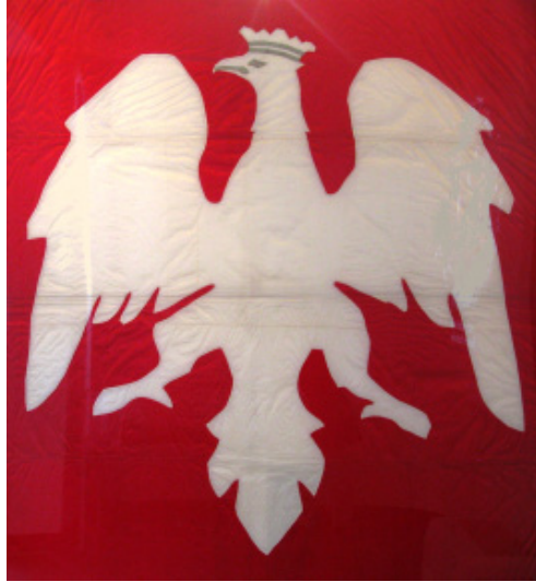
Domniemana bandera okrętu „Kiliński”

Muzealnicy polscy traktują przechowywaną w MWP czerwoną flagę z aplikowanym orłem jako banderę statku „Kiliński”, choć