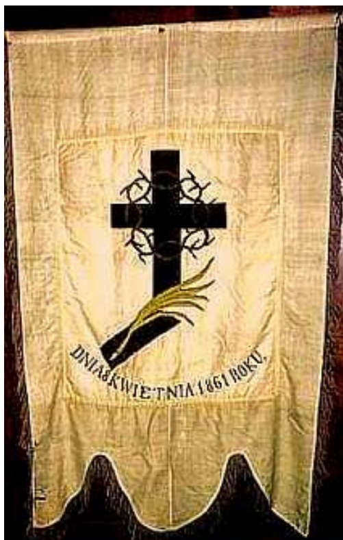
Chorągiew manifestacyjna z 1861 roku przechowywana w kościele parafialnym św. Rozalii i św. Marcina w Zagnańsku.