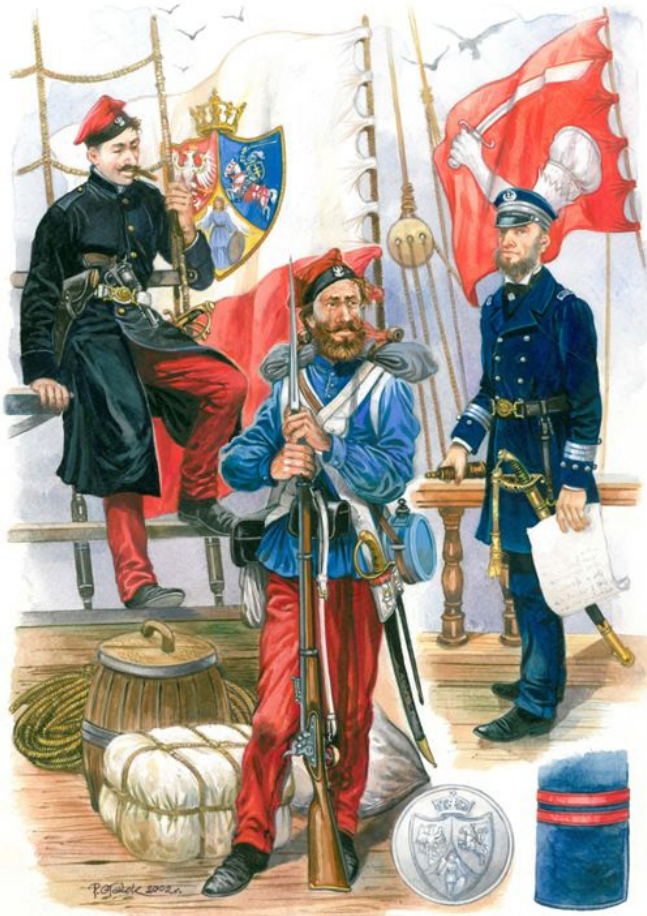
Od lewej: oficer i żołnierz Legionu Bałtyckiego, oficer Sił Morskich Rządu Narodowego 1863 roku. Bandery Sił Morskich odtworzone wg źródeł i przekazów. Mal. P. Głodek, zbiory autora

potwierdzenia tego faktu nie znajdujemy w żadnym dostępnym źródle.