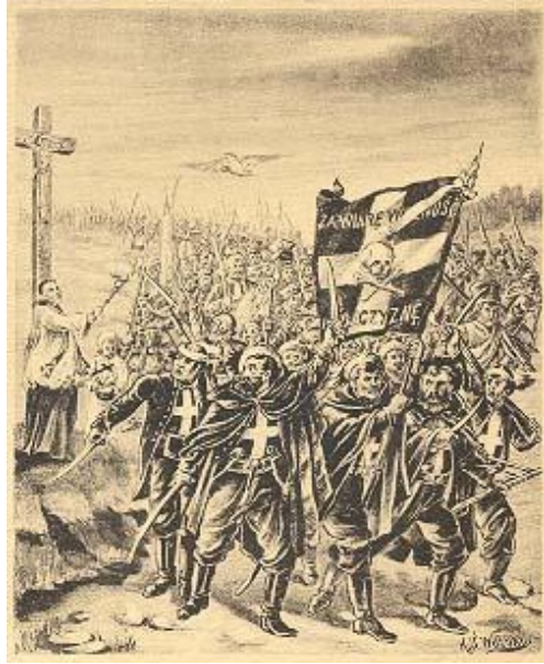
Żuawi Śmierci ze sztandarem, z widoczną na krzyżu czaszką. Pocztówka archiwalna

Tym niemniej ślad symboliki trupiej główki znajdujemy w przekazach dotyczących sztandaru pułku Dzieci Warszawskich, składającego się w większości z młodzieży szkolnej i akademickiej, która różnymi drogami wymykała się z Warszawy do Puszczy Kampinoskiej, aby tam, początkowo z kijami lub byle jaką bronią, stanąć do walki z najpotężniejszą armią Europy. W krótkim czasie Dzieci Warszawskie wyrosły na wytrawnych wojowników, budząc postrach w rosyjskich szeregach 13 .