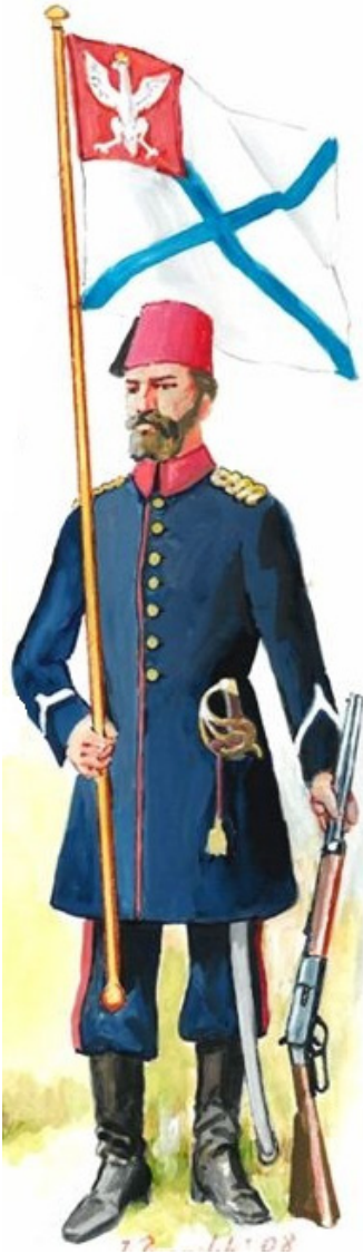
Oficer Legionu Polskiego (Azjatyckiego) w Turcji z sztandarem. Mal. J. Bronclik, zbiory autora

petersburskiego Ermitażu, a jego historia i przynależność opisane są na fiszce w sposób całkowicie absurdalny i bałamutny 11 .