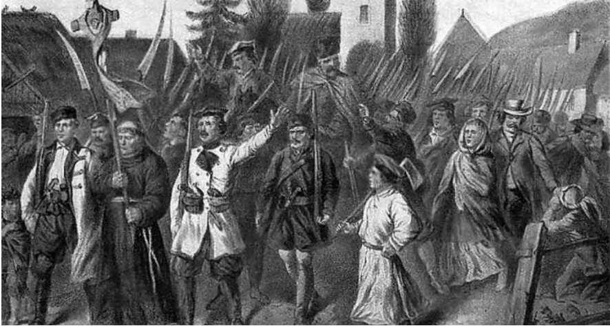
Bernardyn z krzyżem na czele powstańczej partii wychodzącej do lasu koło Grodna, pocztówka z pocz. XX wieku, własność autora