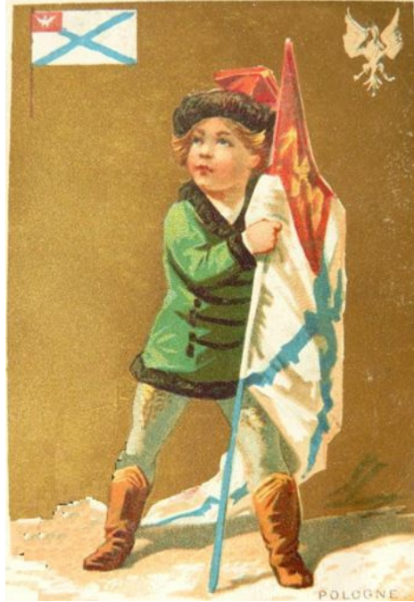
Archiwalna pocztówka patriotyczna przedstawiająca dziecko ze sztandarem polskiego Legionu Azjatyckiego w Turcji, tu opisany jako bandera polskiej floty handlowej