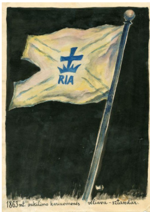
Sztandar powstańczy powiatu szawelskiego. Archiwalna pocztówka litewska przechowywana w Muzeum Aušra w Szawlach na Litwie i oryginalny malunek tego sztandaru