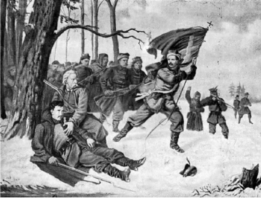
Sztandar W. Lewandowskiego podczas ataku na Łaskarzew.

Mal. J. Jaroszyński, źródło: domena publiczna,