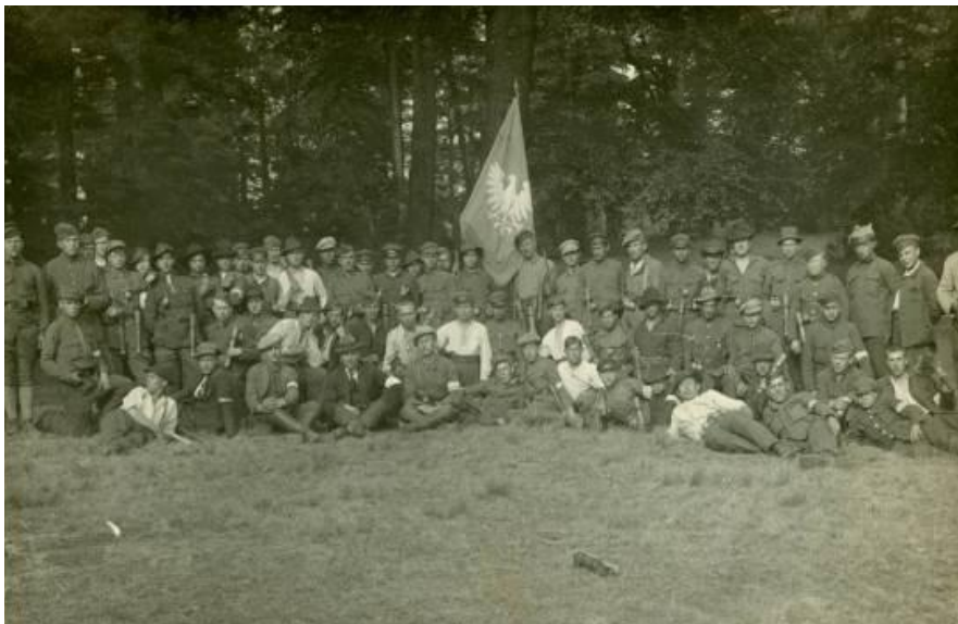
Kompania szturmowa Grupy Destrukcyjnej „Wawelberga” (czerwiec/lipiec 1921).