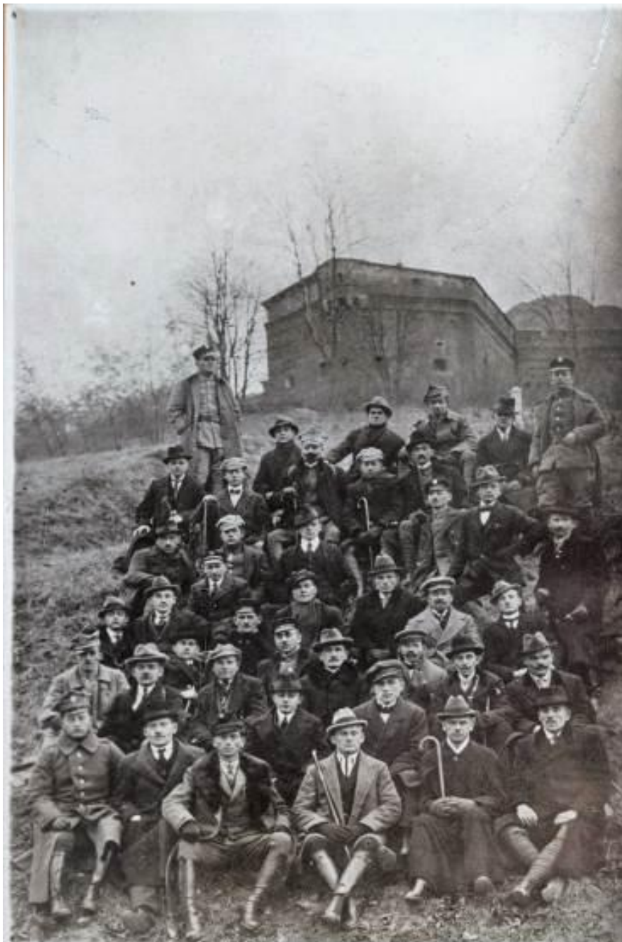
Uczestnicy kursu destrukcyjnego (Stoki Cytadeli w Warszawie, 1921). Muzeum Górnośląskie w Bytomiu, Dział Historii, sygn. H/ZF/586