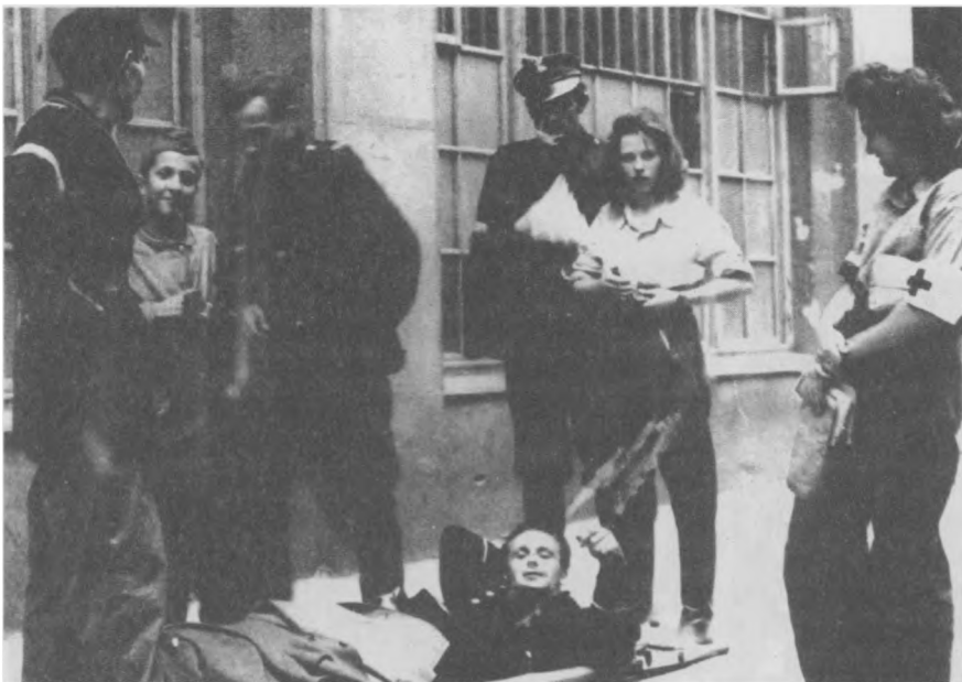
Scena uliczna z Powstania Warszawskiego 1944 r.