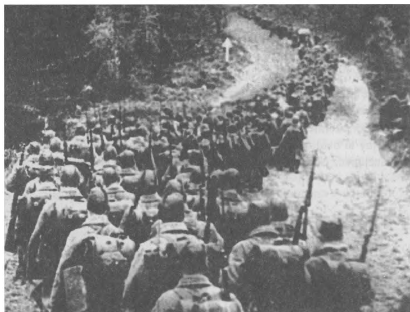
Wojska sowieckie wkraczają na terytorium Polski, (okolice Przemyśla), 17 września 1939 r.