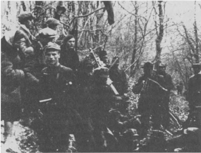
Oddział partyzancki AK na północno-wschodnich terenach Polski