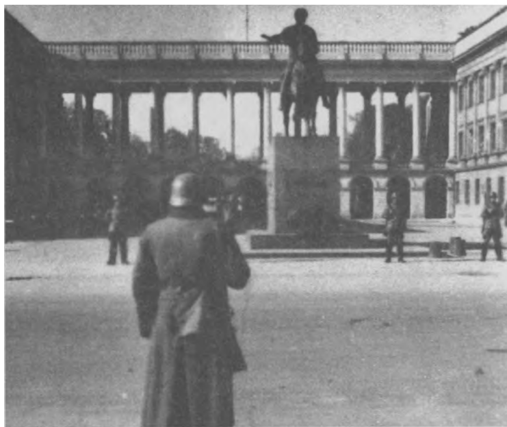
Warta niemiecka przed Pałacem Saskim