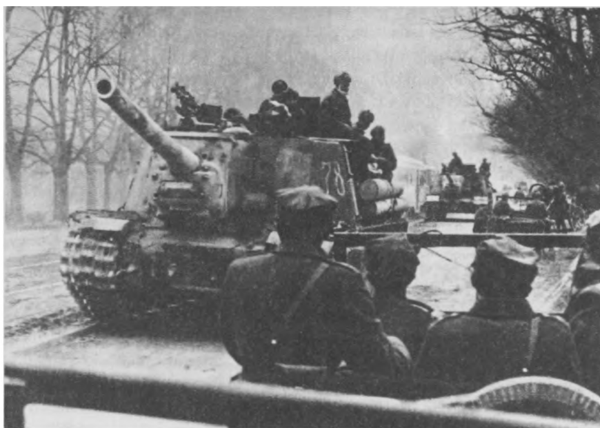
Wyzwolenie spod okupacji niemieckiej, Gdańsk 1945 r.