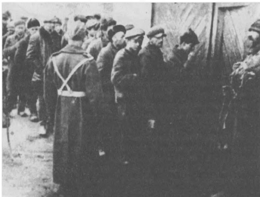
Tworzenie armii polskiej w ZSRR - kolejka przed komisją poborową, 14 sierpnia 1941 r.