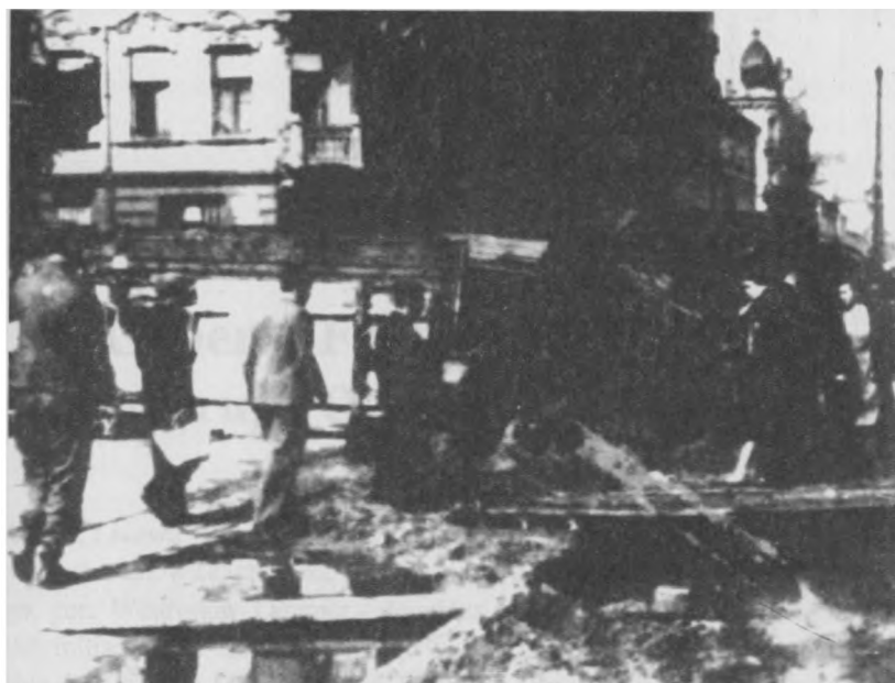
Powstanie Warszawskie, barykada na ul. Żelaznej.