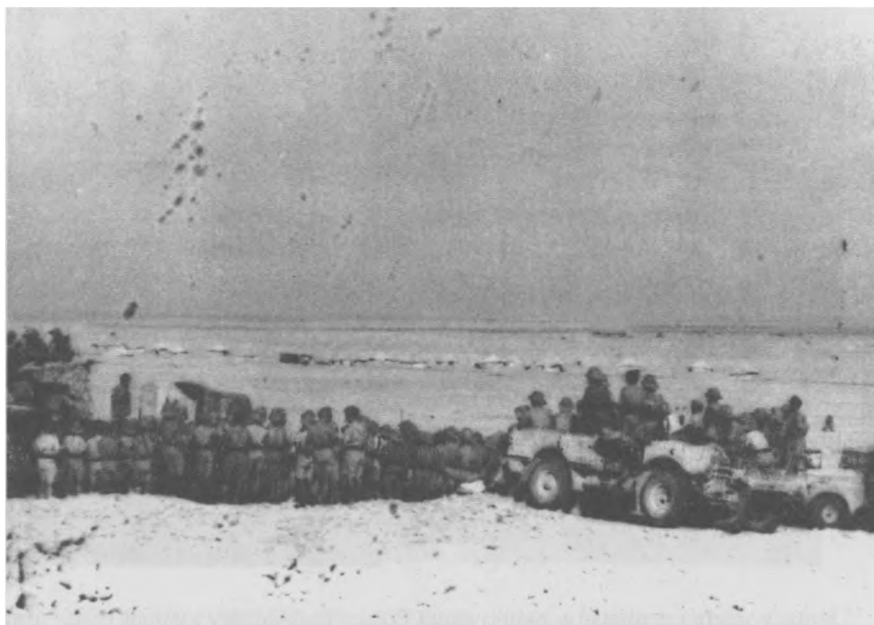
Grupa żołnierzy II Korpusu na Bliskim Wschodzie.