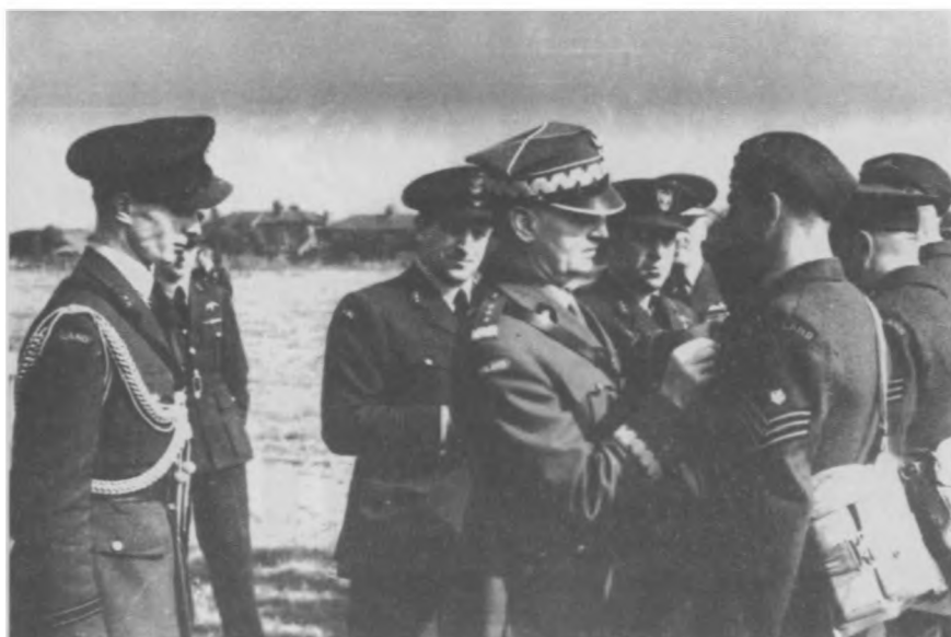
Gen. Władysław Sikorski odznacza grupę żołnierzy PSZ na Zachodzie