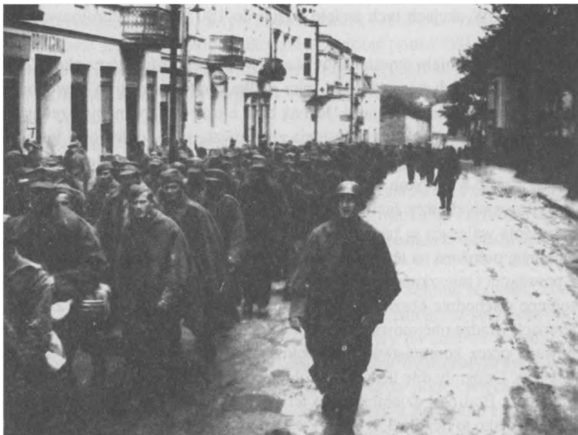
Żołnierze polscy w drodze do niewoli po kampanii wrześniowej 1939 r.