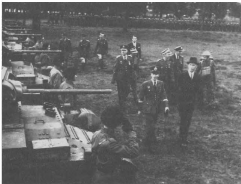
Prezydent Raczkiewicz wizytuje 10 psk 1 DP w Szkocji, 1943 r.