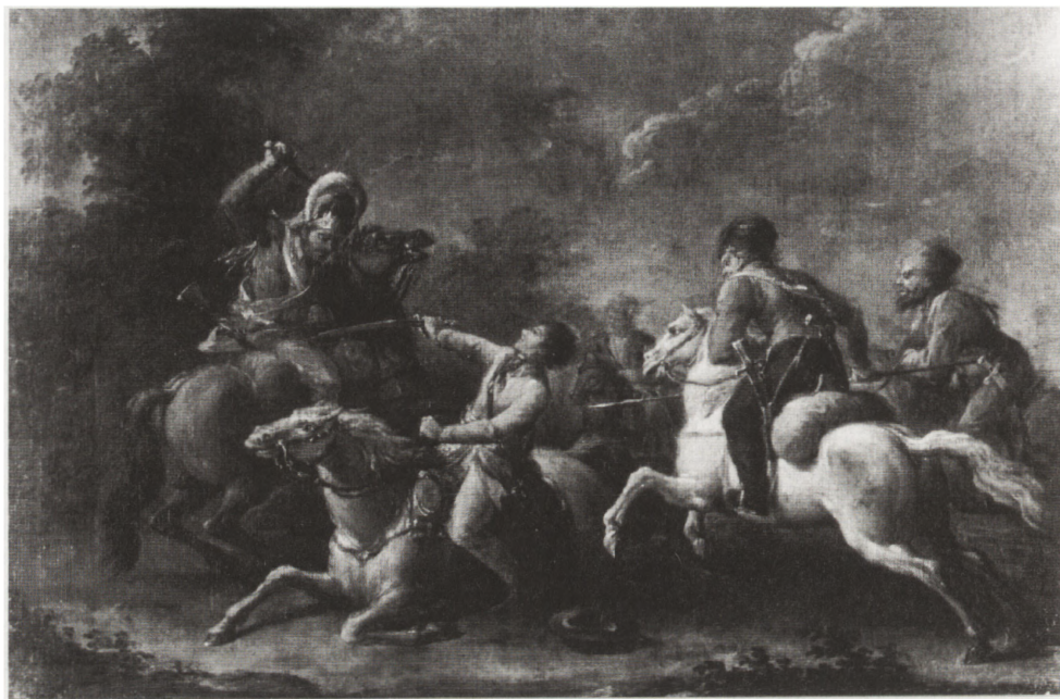
Jan Bogumił Plersch, Tadeusz Kościuszko ranny w bitwie pod Maciejowicami, 10 X 1794 r. Płótno, olej. Wł. Muzeum WP w Warszawie.