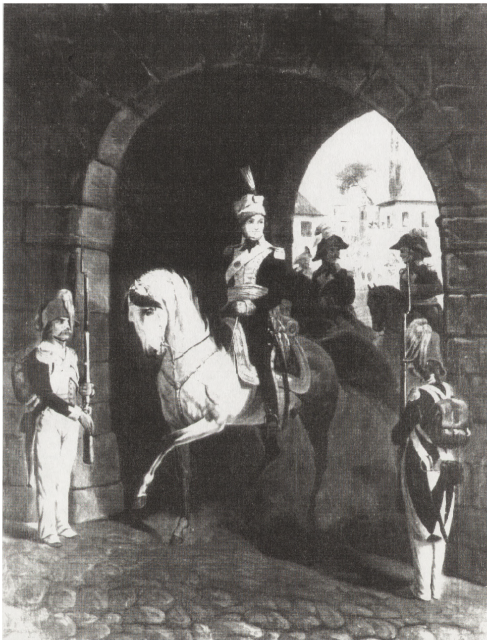
January Suchodolski, Wjazd gen. Jana Henryka Dąbrowskiego do Rzymu, 1 maja 1798 r. Płótno, olej. Wł. Muzeum WP w Warszawie.