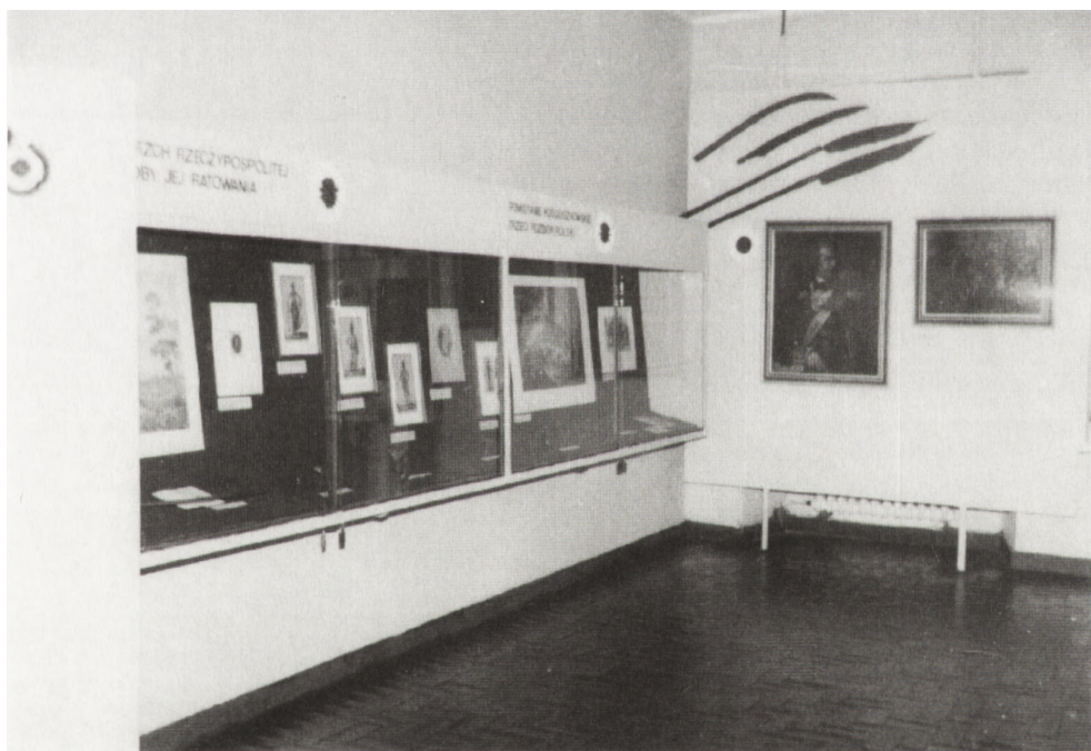
Fragment wystawy pt. "200-lecie Mazurka Dąbrowskiego" w Muzeum Wojska Polskiego w Warszawie.

Ekspozycjom w Polsce i za granicą towarzyszyła broszura pt. Polska pieśń wolności - Il Canto Polacco di Liberta - Le Chant Polonais de la Liberté , wydana staraniem Stowarzyszenia Miłośników Tradycji Mazurka Dąbrowskiego, pod red. Cezarego Leżańskiego. Opracowano ją w języku polskim. Na końcu zamieszczono streszczenia po włosku i po francusku.