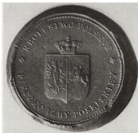
Pieczęcie Rządu Narodowego i Izby Poselskiej z 1831 r.