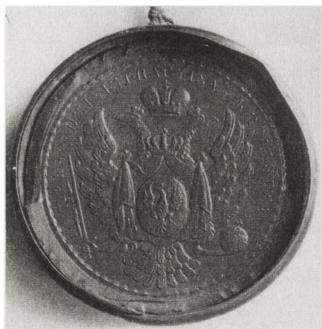
Pieczęć Rady Administracyjnej z herbem Królestwa Polskiego z lat dwudziestych XIX wieku.