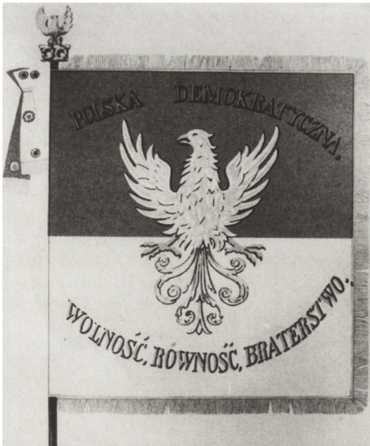
Chorągiew Towarzystwa Demokratycznego Polskiego z 1832 r. (przerys.).