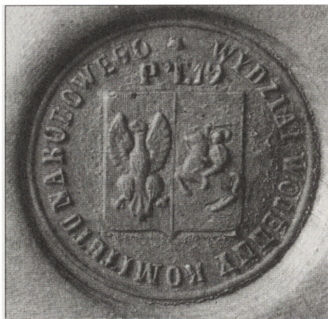
Tłok i odcisk pieczęci Wydziału Wojennego Komitetu Narodowego z okresu powstania wielkopolskiego 1848 r.