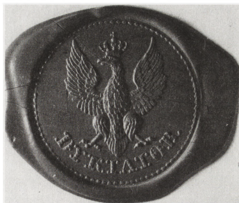
Pieczęć generała Józefa Chłopickiego jako Dyktatora powstania z grudnia 1830 r.