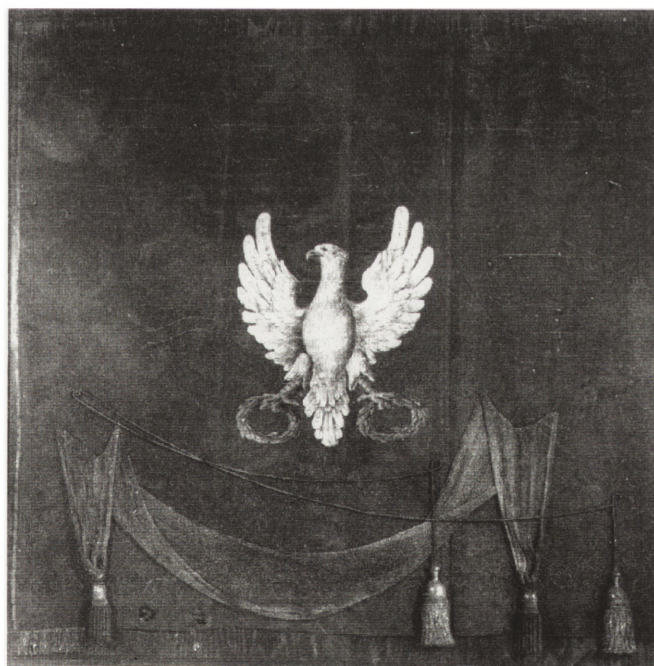
Chorągiew z okresu powstania krakowskiego 1846 r. (na płacie chorągwi rozpięta szarfa i sznury dyktatora powstania).