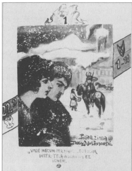
PRACE TADEUSZA POBÓG-ROSSOWSKIEGO (wybór)