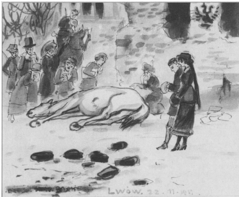
Przed Poczta Główną