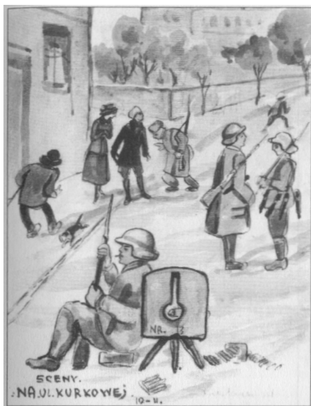
Scena na ul. Kurkowej.