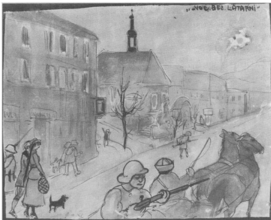
Noc bez latarni.