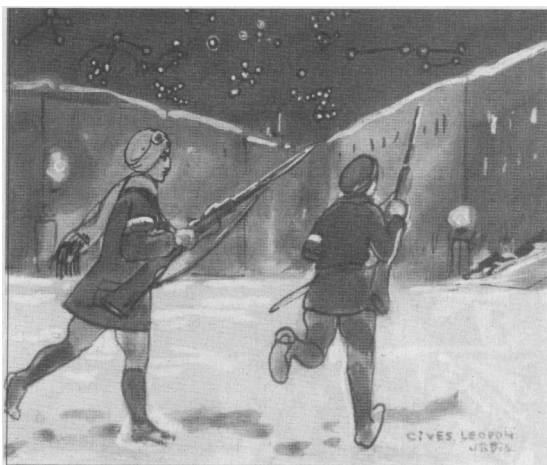
Cives Leopoli Urbis.