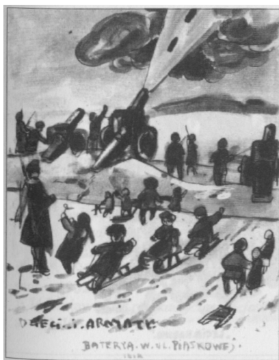
"Dzieci i armaty" (ul. Piaskowa).