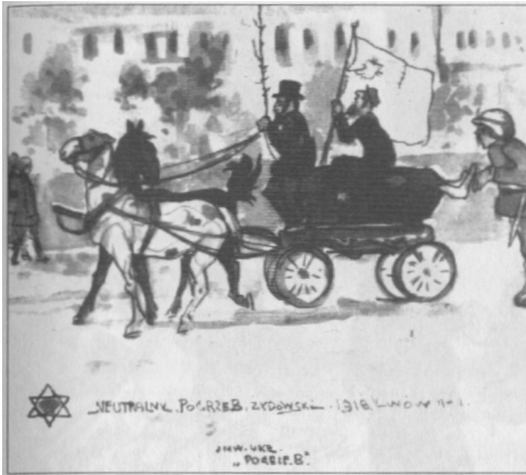
Neutralny pogrzeb żydowski.