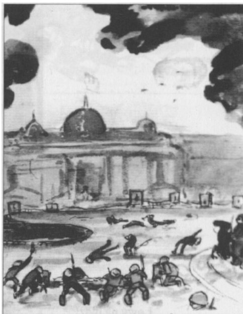
Walki o dworzec.