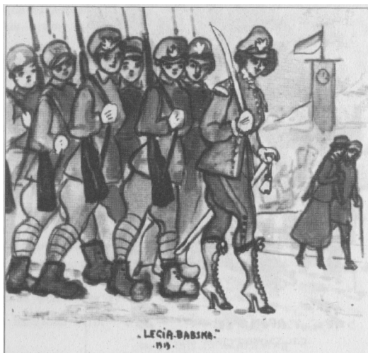
"Legia babska" (1919).