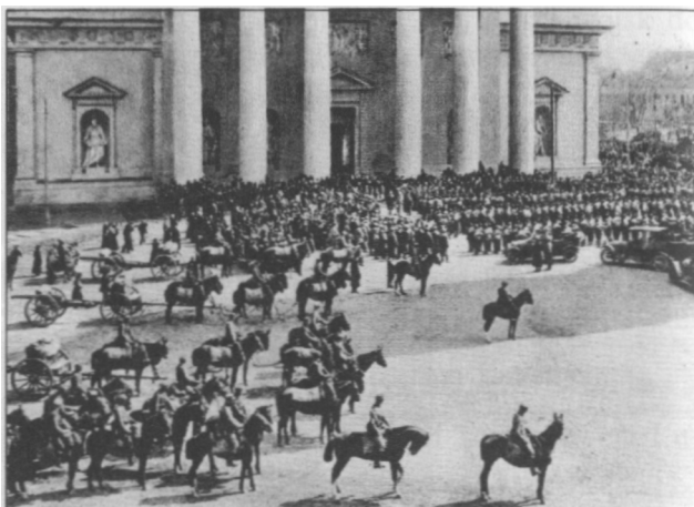
Wkroczenie wojsk polskich do Wilna.