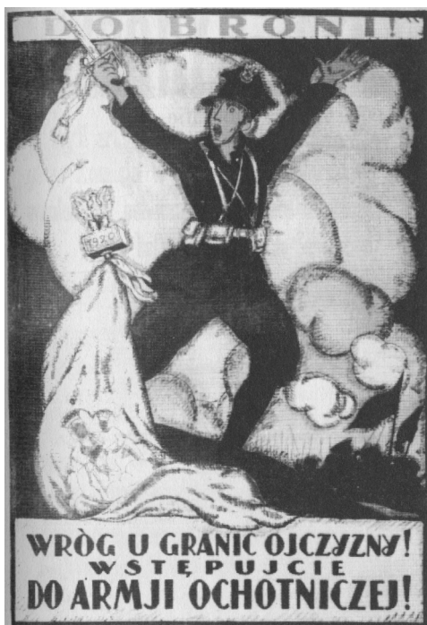
A.N. Wróg u granic Ojczyzny (1920 r.), litografia.