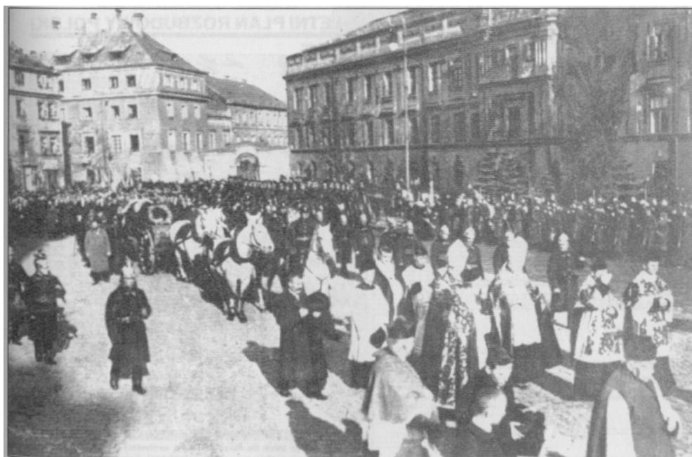
Laweta ze zwłokami Nieznanego Żołnierza, 2 listopada 1925 r.

Obwieszczenie Okręgowej Komisji Wyborczej m.st. Warszawy (kandydatury do Senatu, 1922 r.).