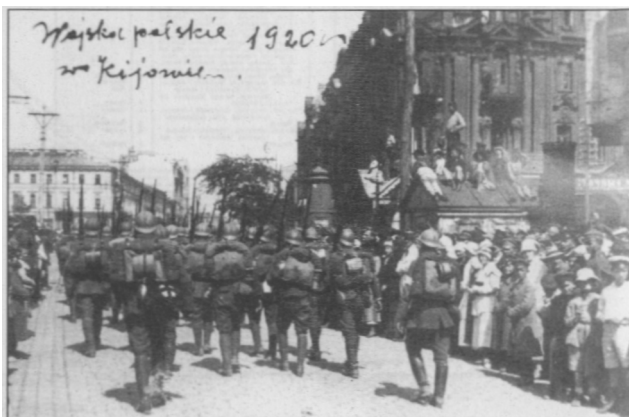
Wojska polskie w Kijowie (1920 r.).