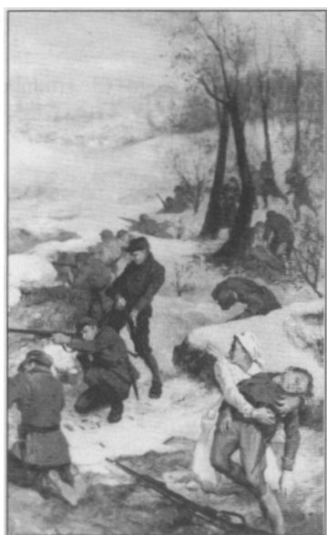
St. Kaczor-Batowski - Obrona Lwowa (obraz, mal. 1938).