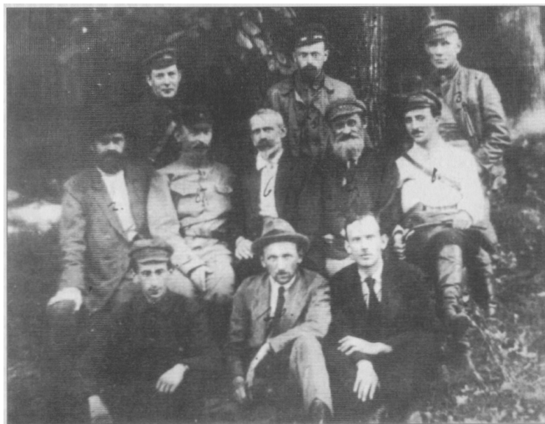
Tymczasowy Polski Komitet Rewolucyjny (z F. Dzierżyńskim, J. Marchlewskim i F. Konem), Białystok, 1920 r.