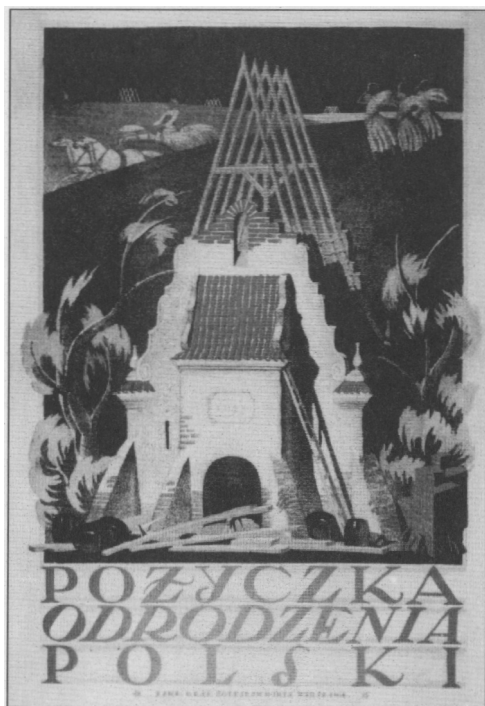
E. Bartłomiejczyk, Pożyczka Odrodzenia Polski, 1920 r., litografia.