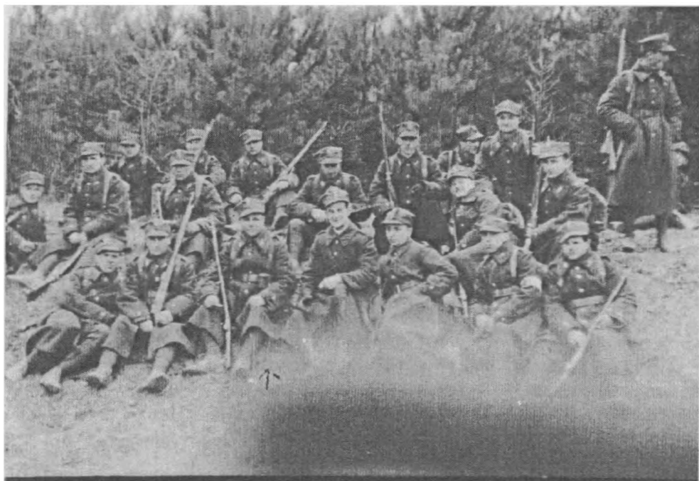
Pluton kompanii chodzieskiej Obrony Narodowej podczas ćwiczeń w okolicach Ujścia, 1938 r.