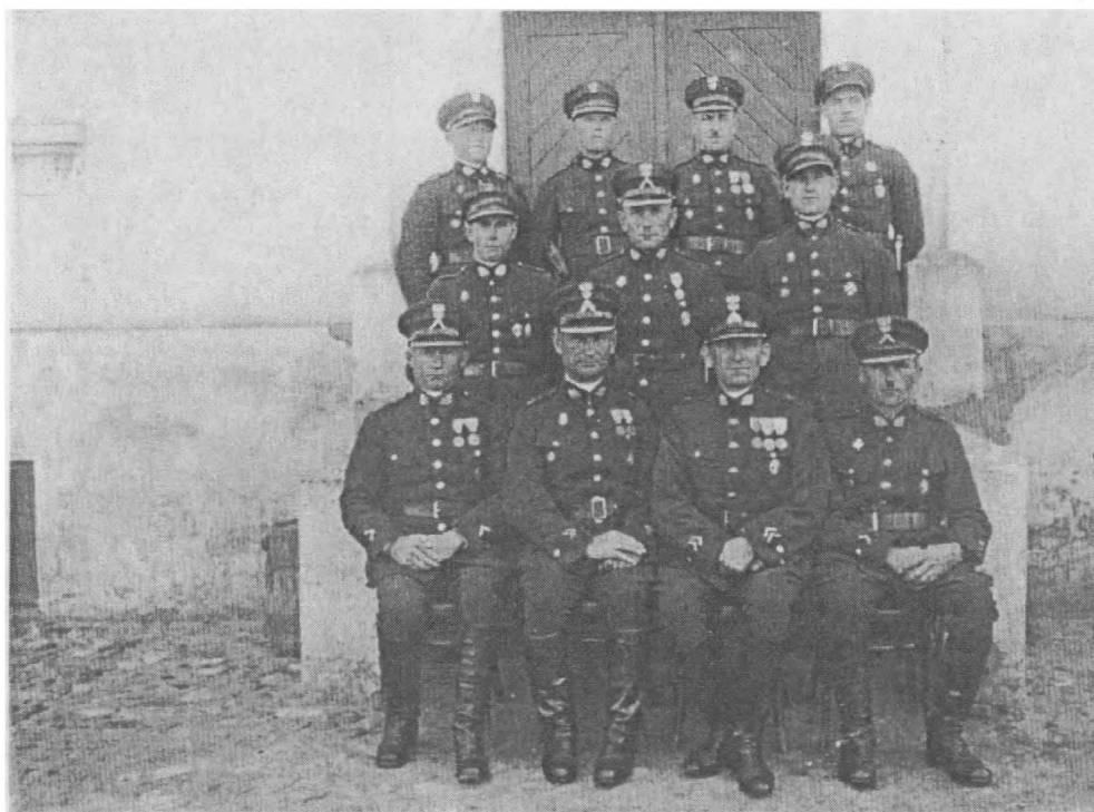
Załoga placówki SG w Bądeczu, 1932 r.