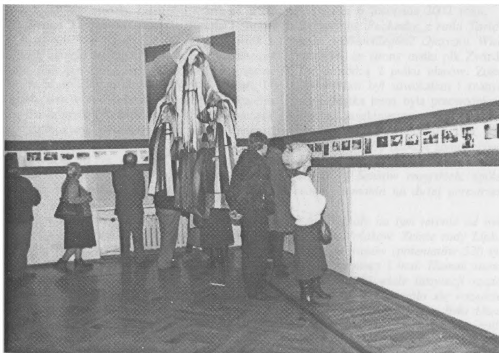
Fragment wystawy „Tamte dni”