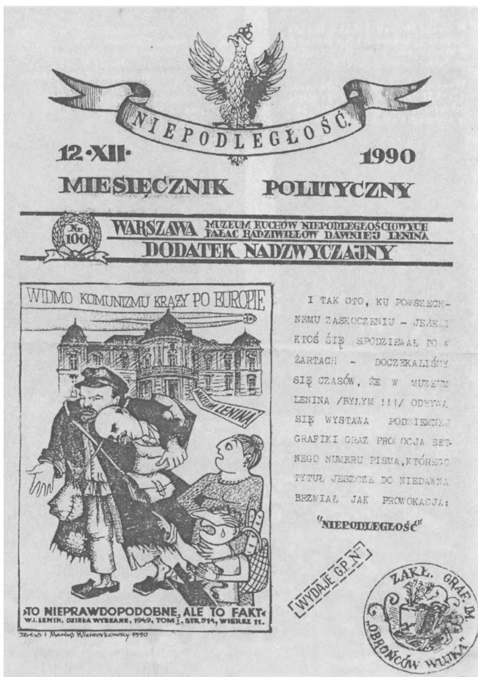
Setny numer miesięcznika politycznego „Niepodległość” z okazji otwarcia wystawy „Grafika podziemia”