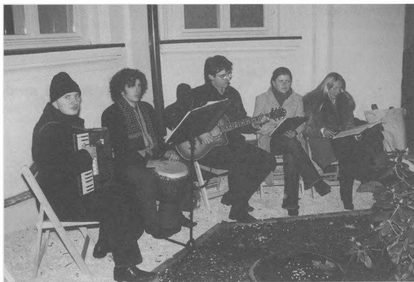
9. Przy płonąącym ognisku pieśni patriotyczne wykonywał zespół „Nexus”