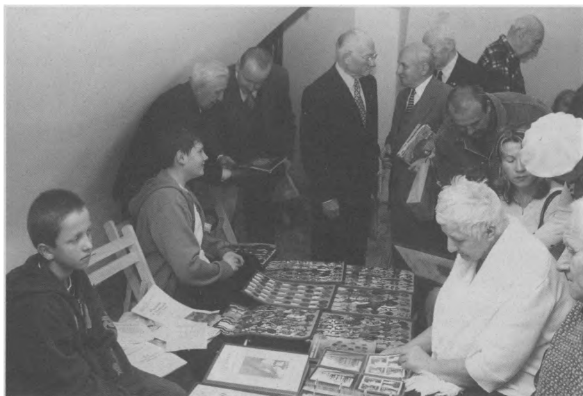
3. Wśród prezentowanych zbiorów członków Siedleckiego Klubu Kolekcjonerów, największe zainteresowanie wzbudzała falerystyka