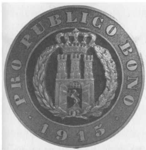
Odznaka „Pro publico bono”, 1915. Jednostronna, stop metali posrebrzany, emaliowany, 34 mm, nr MSM O. 938