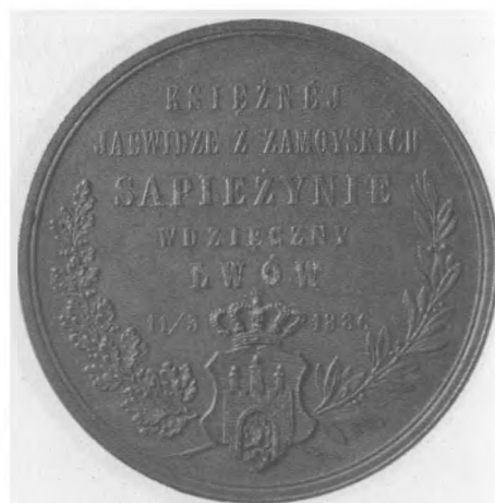
Jadwiga Sapieżyna, 1886 Autor: Wacław Głowacki, rytowanie: Johann Schwerdtner; brąz, bity, 53 mm, Nr MSM MP 5483 (awers i rewers)