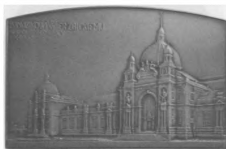
Ludwik Wierzbicki, 1905. Autor: Juliusz Bełtowski; brąz, bity, 57 x 89 mm, nr MSM MP 1317 (awers i rewers)