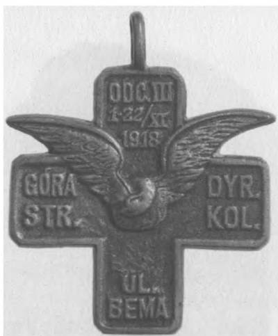
Odznaka pamiątkowa III. Odcinka Obrony Lwowa, 1919. Proj.: kpt. R. Rogoziński. Jednostronna, stop metali oksydowany, 44 x 46 mm, nr MSM O. 686