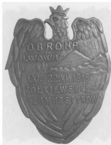
Odznaka pamiątkowa Odcinka Obrony Lwowa Żółkiewskie Zamarstynów, 1919. Sygn.: E. M. Unger Lwów. Jednostronna, stop metali posrebrzany, 52 x 40 mm, nr MSM O. 649