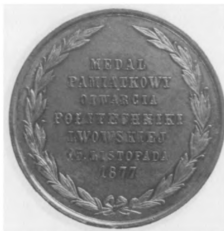
Otwarcie Politechniki we Lwowie, 1877 Autor: Sternberg N.; cynk, bity, 56 mm, nr MSM MP 2157 (awers i rewers)