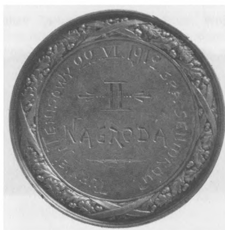
Towarzystwo Łyżwiarskie we Lwowie, pocz. XX w. Srebro, bity, 44 mm, nr MSM MP 1951 (awers i rewers)