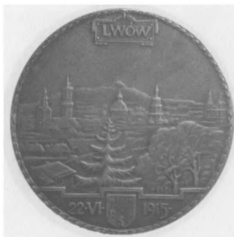
Na pamiątkę oswobodzenia Lwowa, 1915. Autor: Jan Wysocki; srebro, bity, 50 mm, nr MSM MP 5087 (awers i rewers)