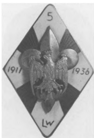
Odnaka 5. Hufca Harcerskiego we Lwowie, 1936. Proj.: R. Mękicki, Sygn.: S. Sobczyk Lwów. Jednostronna, mosiądz emaliowany, 36 x 25 mm, nr MSM O. 2988