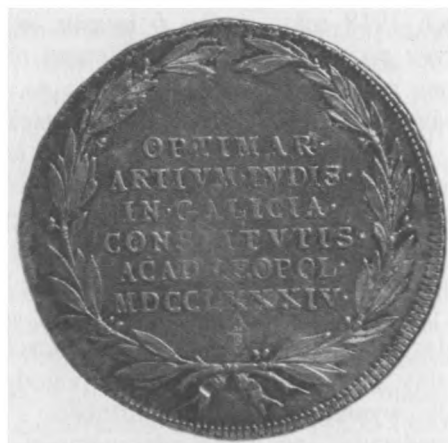
Otwarcie Uniwersytetu Józefińskiego we Lwowie, 1784; srebro, bity, 24 mm, nr MSM MP 1799 (awers i rewers)