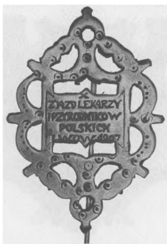
Odznaka X. Zjazdu Lekarzy i Przyrodników Polskich we Lwowie, 1907. Sygn.: W. Sknerzył Lwów. Jednostronna, mosiądz, 50 x 35 mm, nr MSM O. 12869