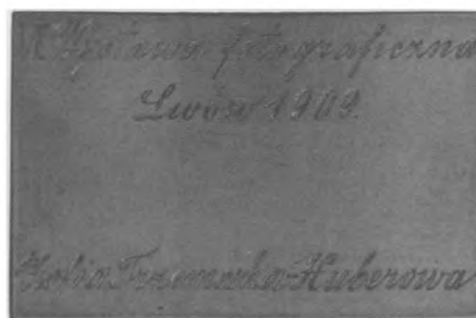
Lwowskie Towarzystwo Fotograficzne, XIX/XX w. Brąz, bity, 39 x 60 mm, nr MSM MP 6934 (awers i rewers)