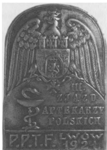
Odznaka III. Zjazdu Aptekarzy Polskich we Lwowie, 1921. Sygn.: E. M. Unger Lwów. Jednostronna, stop metali posrebrzany, 33 x 24 mm, nr MSM O. 14177 20.