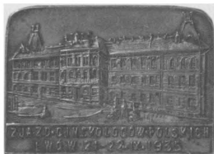
Odznaka Zjazdu Ginekologów Polskich we Lwowie, 1935. Jednostronna, brąz, 20 x 27,6 mm, nr MSM O. 14174