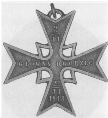
Odznaka pamiątkowa IV. Odcinka Obrony Lwowa, 1921. Proj.: R. Mękicki. Wyk.: E. M. Unger Lwów Jednostronna, stop metali posrebrzany, 37 x 37 mm, nr MSM O. 665