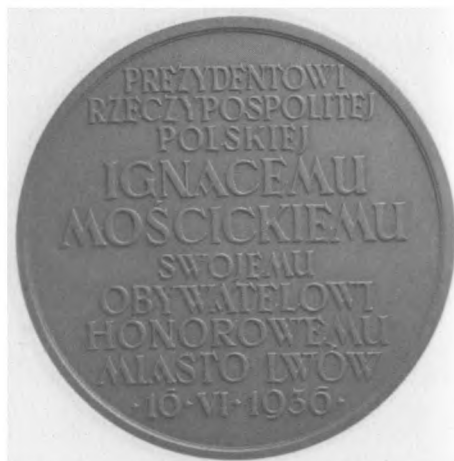
Obywatelstwo Honorowe M. Lwowa dla prezydenta RP Ignacego Mościckiego, 1936. Autor: Rudolf Mękicki; brąz, bity, 65 mm, nr MSM MP 4554 (awers i rewers)