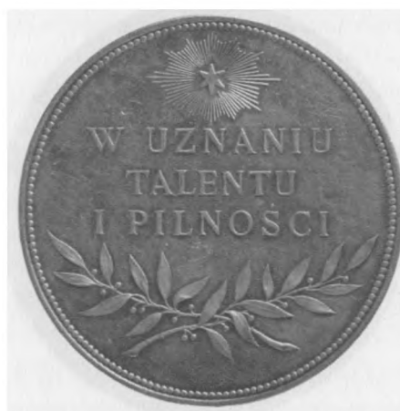
Konserwatorium Galicyjskiego Towarzystwa Muzycznego we Lwowie, 1890. Autor: Anton Scharff; srebro, bity, 55 mm, nr MSM MP 2598 (awers i rewers)