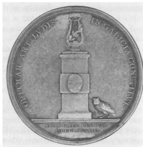
Ukonstytuowanie się Uniwersytetu Józefińskiego we Lwowie, 1784 Autor: Johann Nepomuk Wirth; srebro, bity, 42 mm, nr inw. MSM MP 5509 (awers i rewers)