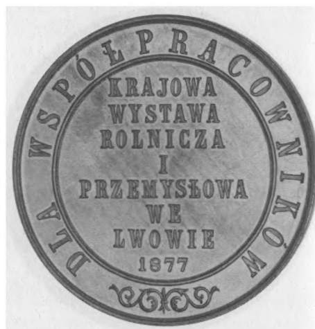
Krajowa Wystawa Rolnicza i Przemysłowa we Lwowie, 1877 Autor: Carl Radnitzky; brąz posrebrzany, bity, 56 mm, nr MSM MP 5498 (awers i rewers)