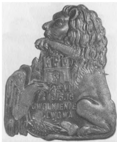
Odznaka „Uwolnienie Lwowa”, 1916. Proj.: J. Maleta. Jednostronna, stop metali posrebrzany, 30 x 25 mm, nr MSM O. 1146