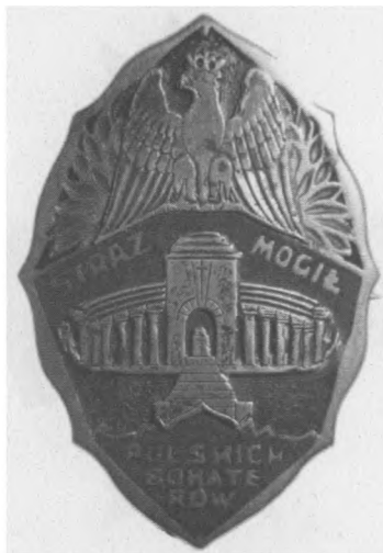
Odznaka Straży Mogił Polskich Bohaterów, po 1929. Proj.: R. Mękicki Sygn.: S. Sobczyk Lwów. Jednostronna, stop metali pozłacany, posrebrzany, emaliowany, 42 x 29 mm Nr MSM O. 3005