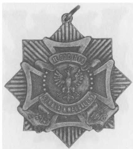
Odznaka pamiątkowa II. Odcinka Obrony Lwowa, 1921. Proj.: W. Perucki. Jednostronna, stop metali posrebrzany, 48 x 45 mm, nr MSM O. 691