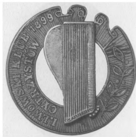
Odznaka I. Lwowskiego Klubu Cytrystów, 1899. Jednostronna, stop metali posrebrzany, emaliowany, 29 mm Nr MSM O. 14175

Medale lwowskie – wybór ze zbiorów Muzeum Sztuki Medalierskiej oddział Muzeum Miejskiego Wrocławia