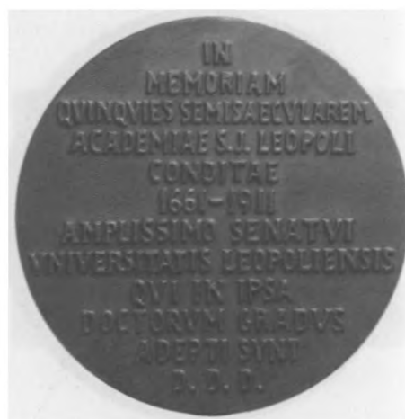
250. rocznica założenia Uniwersytetu we Lwowie, 1911. Autor: Tadeusz Błotnicki; brąz, bity, 59 mm, nr MSM MP 4789 (awers i rewers)