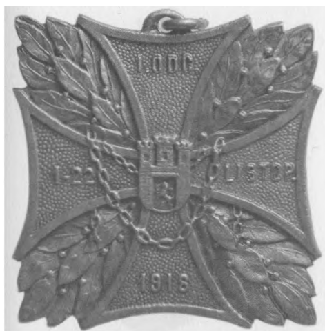
Odznaka pamiątkowa I. Odcinka Obrony Lwowa, 1921. Proj.: J. Maleta Sygn.: E. M. Unger Lwów. Jednostronna, stop metali posrebrzany, 46 x 45,5 mm, nr MSM O. 681