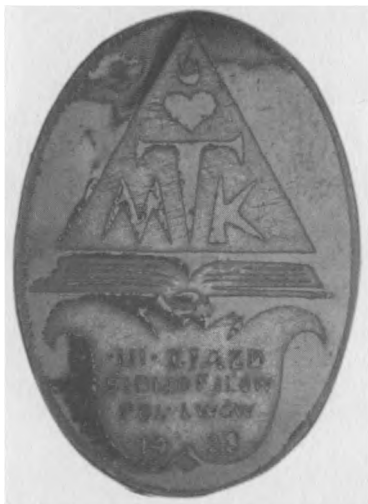
Odznaka III. Zjazdu Bibliofilów Polskich we Lwowie, 1928. Proj.: R. Mękicki. Jednostronna, stop metali emaliowany, 31 x 23 mm, nr MSM O. 2985