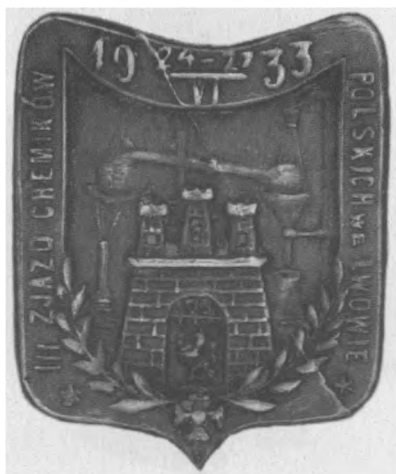
Odznaka pamiątkowa III. Zjazdu Chemików Polskich we Lwowie, 1933. Sygn.: W. Buszek Lwów. Jednostronna. Stop metali posrebrzany, 21 x 19 mm, nr MSM MP 12878