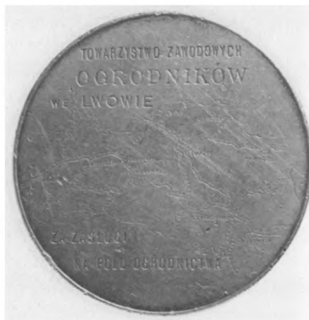
Towarzystwo Zawodowych Ogrodników we Lwowie, kon. XIX w. Autor: Joseph Christl-bauer; srebro, bity, 50 mm, nr MSM MP 2595 (awers i rewers)