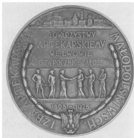
60-lecie Towarzystwa Aptekarskiego we Lwowie, 1928. Autor: Piotr Wojtowicz; srebro, bity, 55 mm, nr MSM MP 4957 (awers i rewers)