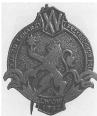
Odznaka XV. Zjazdu Lekarzy i Przyrodników we Lwowie, 1937. Jednostronna. Mosiądz, 31 x 27 mm, nr MSM O. 13768