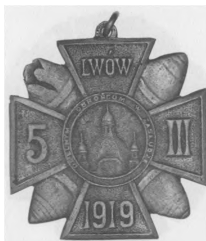
Odnaka pamiątkowa „Wybuch amunicji na Dworcu Czerniowieckim”, 1919. Proj.: M. Szpindler. Jednostronna, stop metali posrebrzany, 46 x 46 mm, nr MSM O. 690