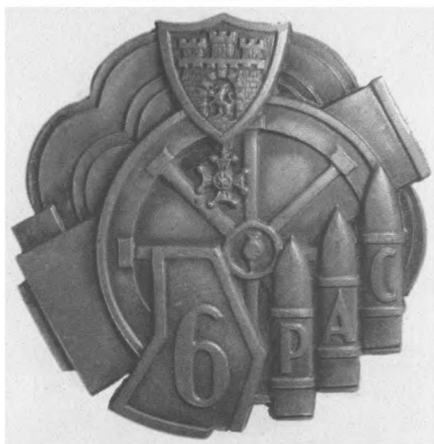
Odznaka 6. Pułku Artylerii Ciężkiej we Lwowie, 1934. Proj.: R. Mękicki Sygn.: W. Gontarczyk Warszawa ul. Miodowa No 19. Jednostronna, srebro, 31,4 x 35 mm, nr MSM O. 2994