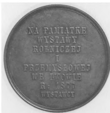
Włodzimierz Dzieduszycki, 1877 Autor: Carl Radnitzky; srebro, bity, 74,4 mm, nr MSM MP 5326 (awers i rewers)