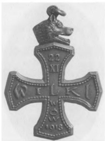
Krzyż pamiątkowy kawalerii „Wilki”, 1921. Sygn.: E. M. Unger Lwów. Jednostronny, stop metali posrebrzany, 41,5 x 31 mm, nr MSM O. 659