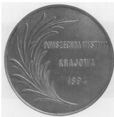
Powszechna Wystawa Krajowa we Lwowie, 1894. Autor: Cyprian Godebski, rytowanie: Henri Nocq; srebro, bity, 63 mm, nr MSM MP 5499 (awers i rewers)