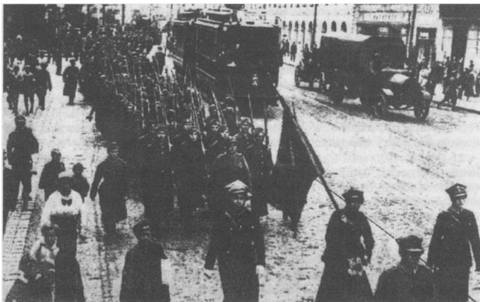
Wymarsz Batalionu Liniowego OLK na front