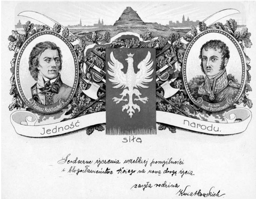
Telegram patriotyczny: życzenia ślubne na barwnym blankiecie ozdobionym portretami Kościuszki i Poniatowskiego, MN E 14575

Przypadająca w roku 1917 setna rocznica śmierci Kościuszki stała się okazją do zorganizowania wielkich uroczystości patriotycznych. Był to dla Polaków czas szczególny, trwały jeszcze działania wojenne, ziemie polskie zniszczone były przez przemarsz wojsk i grabieżczą politykę zaborców, Polacy zaś złożyli już daninę krwi, walcząc w armiach zaborczych oraz formując własne oddziały. Wojna wkraczała w decydującą fazę, rosły nadzieje na odzyskanie niepodległości. „Obchody narodowe były największymi uroczystościami, na jakie zdobyć się mógł naród przez wojnę zbiedzony” 5 .