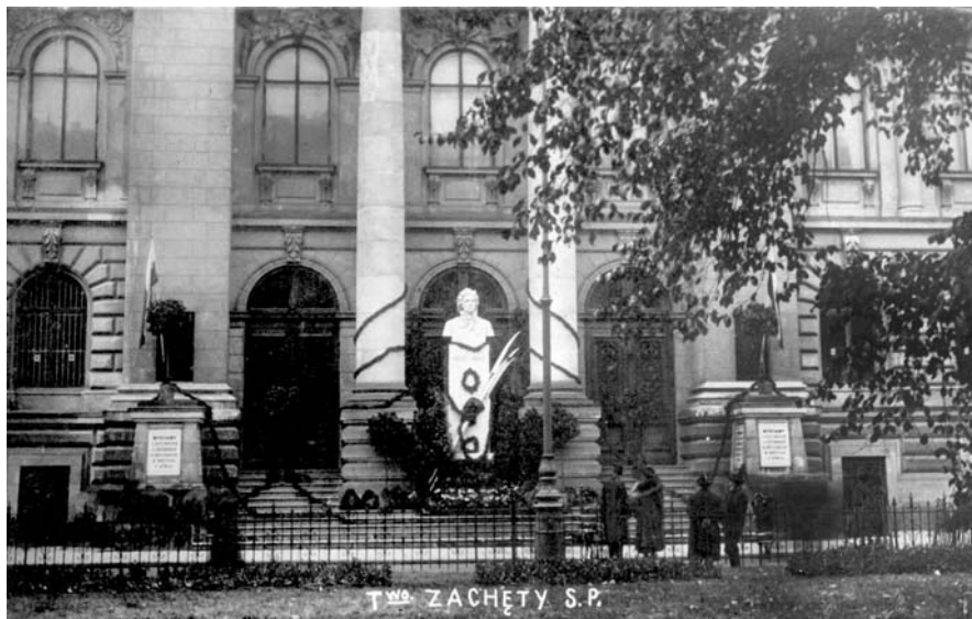
Popiersie Kościuszki przed budynkiem Zachęty, 1917, MN P1173