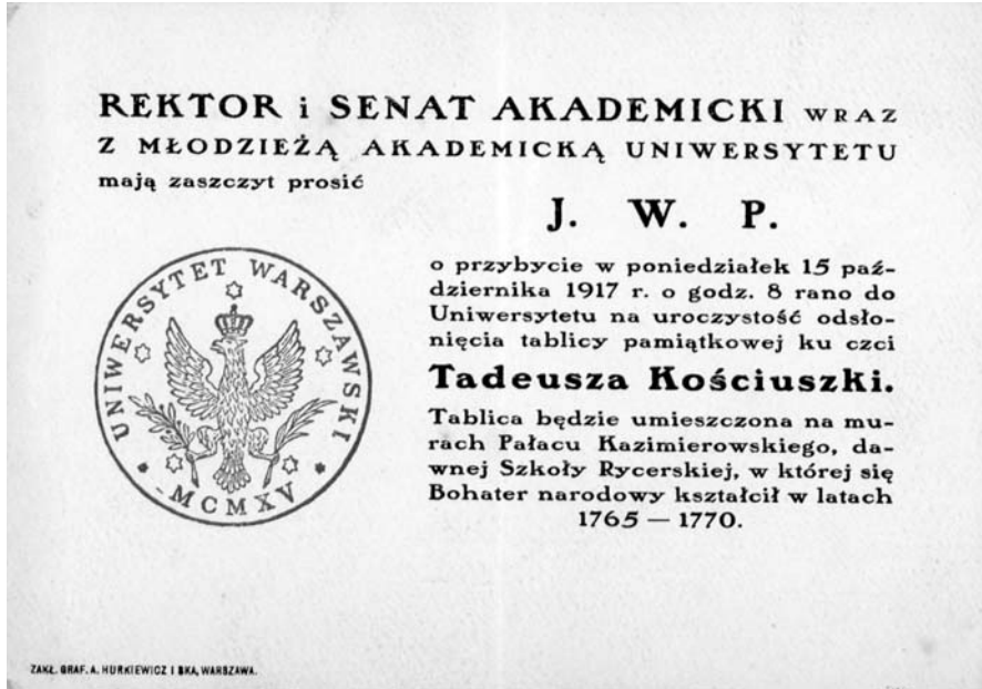
Zaproszenie na uroczystości kościuszkowskie, 1917, MN E12864