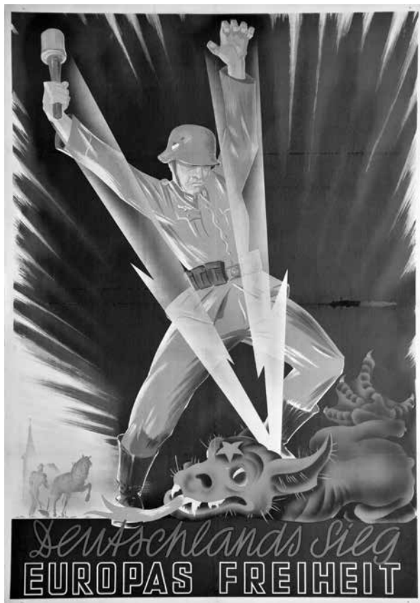
Deutschlands Sieg Europas Freiheit ; sygn. Pl. 2500, Muzeum Niepodległości w Warszawie

demokratów z 1932 roku, którego autorem jest Karl Geiss (sygn. Rep. 116), ciekawa ze względu na wykorzystany motyw. Przedstawia ona półnagą, umęczoną i wychudzoną postać robotnika przywiązanego i wiszącego na ogromnej swastyce. Na pierwszy rzut oka mogą pojawić się skojarzenia z obrazem ukrzyżowanego Chrystusa. Napis na pracy głosi: „Robotnik w Rzeszy pod swastyką! Dlatego wybierz socjaldemokratów!”. Plakat wzbudza emocje, takie jak obawa czy strach, przestrzega przed niebezpieczeństwem, a nawet groźbą utraty życia. Mocny w przekazie, wykorzystujący ostre kolory – na białym tle szczególnie zwracają uwagę czerwony, niebieski i czarny, miał rozbudzić w społeczeństwie refleksję nad przyszłością, po ewentualnym zwycięstwie nazistów. Niestety, tragiczny los, przepowiadany niemieckim robotnikom przez socjaldemokratów, stał