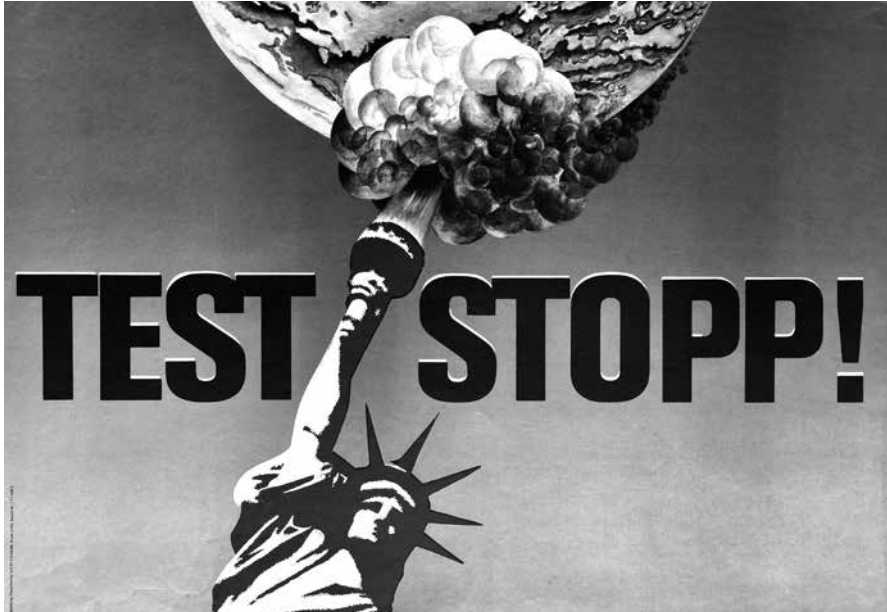
Test Stopp! , Klaus Parche, 1986; sygn. Pl. 7012, Muzeum Niepodległości w Warszawie

chciałoby się rzec spartański, bez zbędnych elementów. Wydaje się, że siła jego przekazu tkwi właśnie w tej prostocie oraz w wykorzystaniu motywów wojskowych.