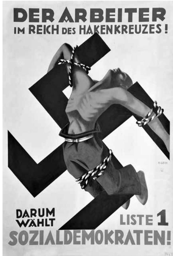
Der Arbeiter im Reich des Hakenkreuzes! Darum wählt Liste 1 Sozialdemokraten!; Karl Geiss; 1932; sygn. Rep. 116, Muzeum Niepodległości w Warszawie

odgórnie linii ideologicznej i propagandowej 2 . Artykuł służy jedynie celom poznawczym i naukowym, poszczególne jego fragmenty nie mają propagować określonej ideologii ani nie są odbiciem poglądów politycznych autora tekstu. Prezentowane prace opisywane są z perspektywy historyka, stąd ocenę ich strony artystycznej autor pozostawia opinii ekspertów.