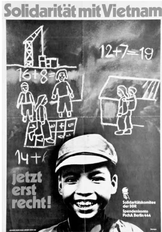
Solidarität mit Vietnam jetzt erst recht! , Jamepo, 1976; sygn. Pl. 5721, Muzeum Niepodległości w Warszawie

przedstawiane są sojusz NATO i Stany Zjednoczone. Taki obraz USA sugeruje na przykład plakat Klausa Parche z 1986 roku (sygn. Pl. 7012), gdzie widnieje amerykańska Statua Wolności. Posąg ten został przedstawiony na niebieskim tle w taki sposób, że znajduje się pod kulą ziemską, w którą wycelowana jest trzymana pochodnia, ucharakteryzowana płomieniami i chmurą dymu na wyrzutnię rakiet balistycznych. Obrazowi towarzyszy wymowny, duży czarny napis „Stop testom!”.