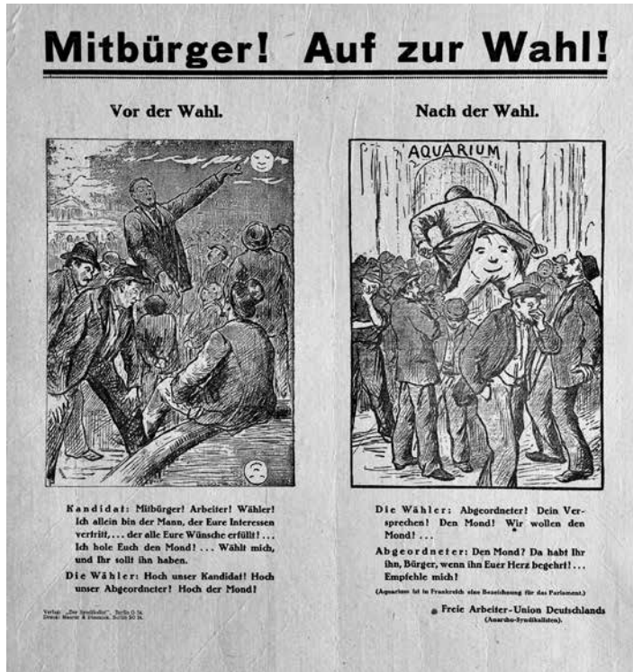
Mitbürger! Auf zur Wahl! ; sygn. Pl. 1530, Muzeum Niepodległości w Warszawie, fot. Tadeusz Stani

strony obraz industrializacji różnych regionów kraju czy wzrost znaczenia PRL w gospodarczych rankingach, z drugiej natomiast nawoływanie do wyrobienia określonych norm zawodowych, pracy sumiennej i zgodnej z przepisami BHP. Opisany zbiór prac dotyczący Polski Ludowej jest bardzo okazały i tematycznie porusza szereg zagadnień.