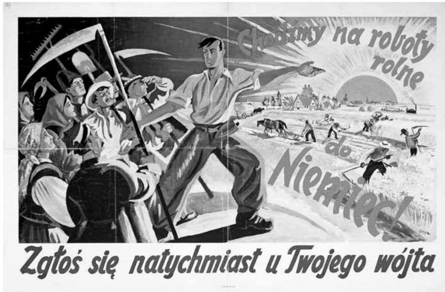
Chodźmy na roboty rolne do Niemiec! Zgłoś się natychmiast u Twojego wójta , E. Kosak, 1943; sygn. Pl. 3236, Muzeum Niepodległości w Warszawie, fot. Tadeusz Stani

się w różnym stopniu udziałem wszystkich narodów znajdujących się pod okupacją Trzeciej Rzeszy 6 .