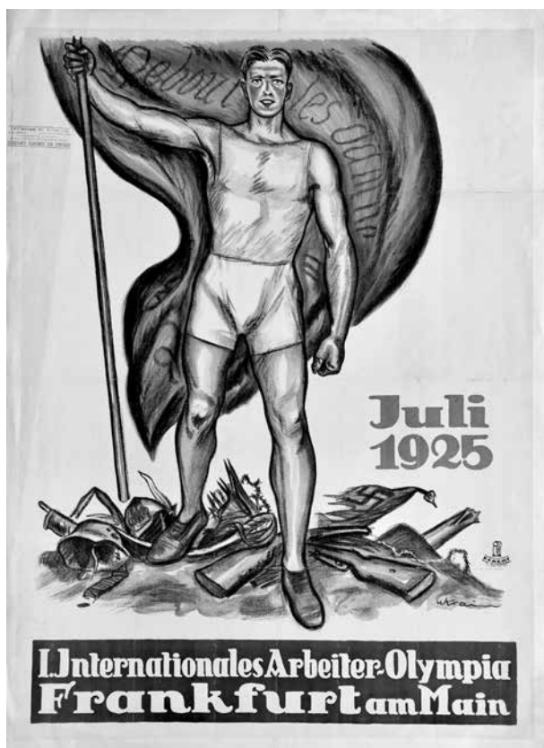
Juli 1925. I. Internationales Arbeiter-Olympia Frankfurt am Main, Willibald Krain, 1925; sygn. Pl. 1546, Muzeum Niepodległości Warszawie

opisując szczegółowo pojedyncze prace poświęcone określonej tematyce, przybliży ich formę graficzną, treść oraz przesłanie. To pozwoli ukazać, w jaki sposób opisywane plakaty spełniały przypisaną im rolę, którą można określić w następujących słowach: przykuwanie uwagi, informowanie, reklamowanie, zachwalanie czy propagowanie. Reasumując – tekst jest próbą przedstawienia jak plakaty te spełniały swą funkcję propagandową. Sygnatury oraz nazwiska autorów poszczególnych prac zostały zaczerpnięte z ksiąg inwentarzowych MN. Tematyka niektórych przedstawionych poniżej prac ma profil polityczny. Część została wytworzona w czasie panowania reżimów: hitlerowskiego i komunistycznego. W związku z powyższym należy mieć na uwadze fakt, że przedstawiany na nich obraz podlegał kontroli cenzury i musiał odpowiadać określonej, dozwolonej i ustalonej