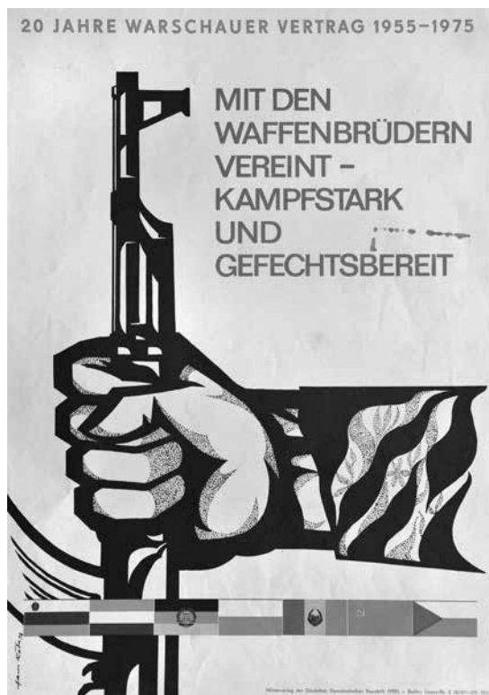
20 Jahre Warschauer Vertrag 1955–1975. Mit den Waffenbrüdern vereint – kampfstark und gefechtsbereit, Hans Rade, 1975; sygn. Pl. 4753, Muzeum Niepodległości w Warszawie

polowych towarzyszy duży czerwony napis: „Chodźmy na roboty rolne do Niemiec”. Dla potencjalnych ochotników jest również informacja, gdzie należy się zgłaszać, w postaci niebieskiego hasła u dołu plakatu: „Zgłoś się natychmiast u Twojego wójta”.