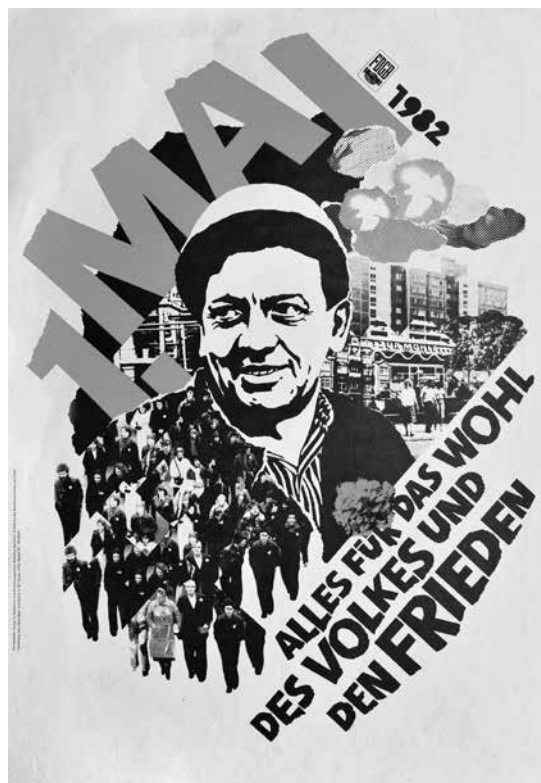
1 Mai 1982. Alles für das Wohl des Volkes und den Frieden, Karl-Heinz Beck, 1982; sygn. Pl. 5712, Muzeum Niepodległości w Warszawie

Na pracy wykonanej w biało-czarnej kolorystyce wyróżnia się czerwony napis „1 maja” oraz hasło „Wszystko dla dobra narodu i dla pokoju”. Na plakacie czerwień kontrastuje z bielą i czernią, ale przewaga tych ostatnich kolorów sprawia, że epatuje z niego przede wszystkim zadowolenie, spokój i stabilizacja. Tak przedstawiany obraz życia w NRD miał stanowić pozytywny kontrast i przeciwagę dla rzeczywistości życia po drugiej stronie żelaznej kurtyny 10 .