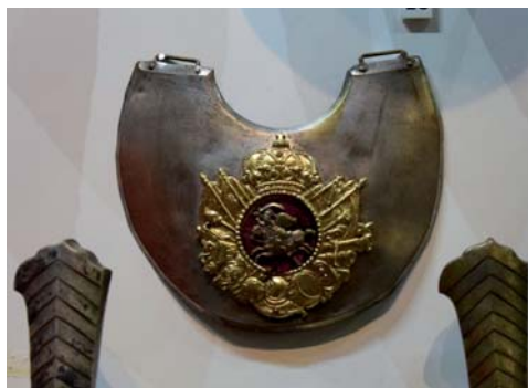
Foto 5. Ryngraf oficerski wojska WXL z pierwszej poł. XVIII w. MWP 24390. Katalog XVIII w., poz.184, nr inw. 4364 MN, fot. Piotr M. Zalewski