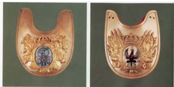
Foto 12. Ryngrafy pruskie z lat 1713–1806, reprodukcja z publikacji: K.-P. Merta, Die Uniformierung... , op. cit., s. 24