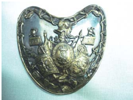
Foto 5b. Ryngraf z okresu panowania Stanisława Augusta Poniatowskiego, Muzeum Narodowe w Krakowie, nr inw. V.1353, fot. Piotr M. Zalewski