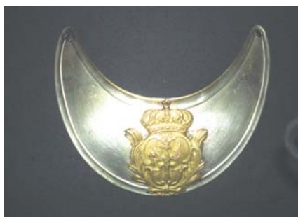
Foto 14. Rymgraf polski XVIII w.(?), Muzeum Narodowe w Krakowie, nr inw. V.1354, fot. Piotr M. Zalewski