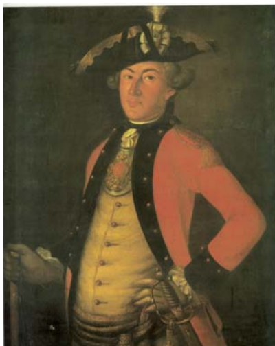
Foto 13. Ryngraf rosyjski oficera artylerii lata 50. XVIII wieku, reprodukcja z publikacji: W.M.Glinka, Russkij wojennyj kostium XVIII–naczala XX wieka , Leningrad 1988, il. nr.12, brak numeracji stron