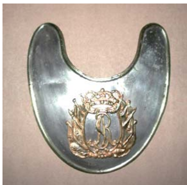
Foto 6. Ryngraf oficerski z czasów Stanisława Augusta Poniatowskiego, Muzeum Narodowe w Warszawie, nr inw. SZM 7273