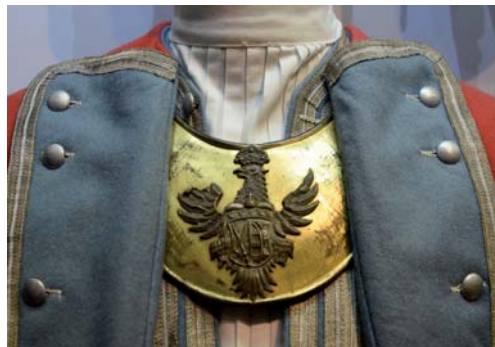
Foto 4. Ryngraf oficerski piechoty polskiej z czasów Augusta II, 1697–1733; mosiądz złocony, orzeł srebrzony, wys. 16 cm, szer. 19,5 cm, MWP 835