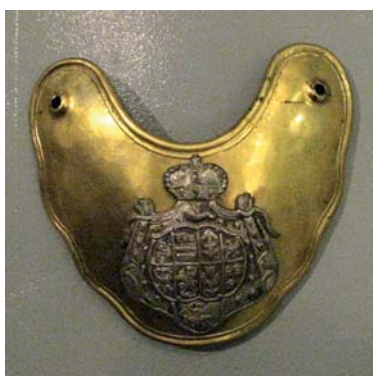
Foto 7. Ryngraf oficerski regimentu 3. pieszego buławy polnej Wielkiego Księstwa Litewskiego, na którym oprócz Pogoni mamy także herb Lis szefa regimentu Aleksandra Michała Sapięhy (1762–1775), MWP, nr inw. 966 MWP