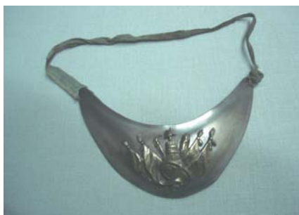
Foto 15. Rymgraf francuski, pocz. XIX w., Muzeum Narodowe w Krakowie, nr inw. V.1352