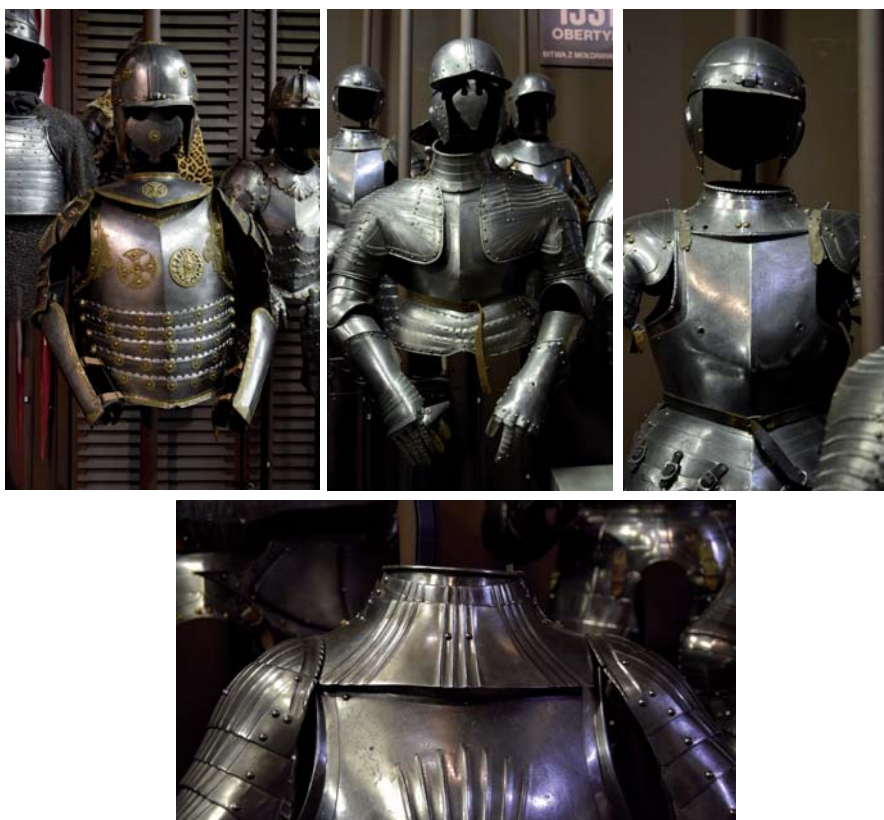
Foto 1. Obojczyki przy zbrojach, XVI w., Muzeum Wojska Polskiego w Warszawie: MWP 678/3*, MWP 52473, MWP 279/4*, MWP 196/4*