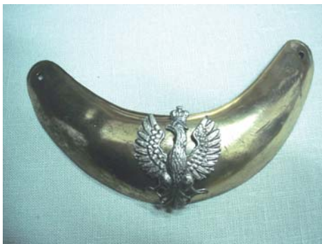
Foto 8. Ryngraf oficera wyższego piechoty z okresu Księstwa Warszawskiego, lata 1810–1814, Muzeum Narodowe w Krakowie, nr inw. V. 290, fot. Piotr M. Zalewski