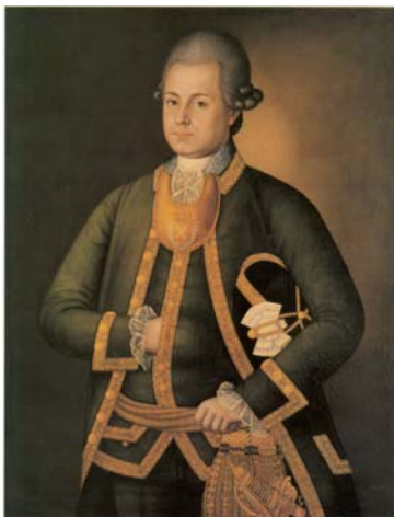
Foto 13a. Rymgraf rosyjski oficera lejbgwardii z 1774 roku, reprodukcja z publikacji: Glinka W.M., Russkij wojennyj kostium XVIII–naczała XX wieka , Leningrad 1988r, il. nr15, brak numeracji stron