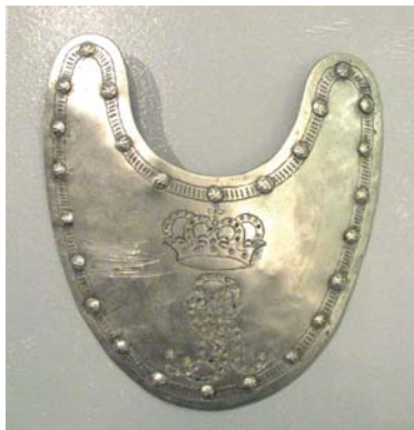
Foto 7a. Ryngraf oficera z lat 1764–1775, Muzeum Wojska Polskiego w Warszawie, nr inw. 964 MWP