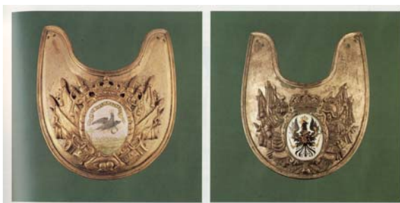
Foto 12a. Ryngrafy pruskie z lat 1713–1806, reprodukcja z publikacji: K.-P. Merta, Die Uniformierung... , op. cit., s. 25