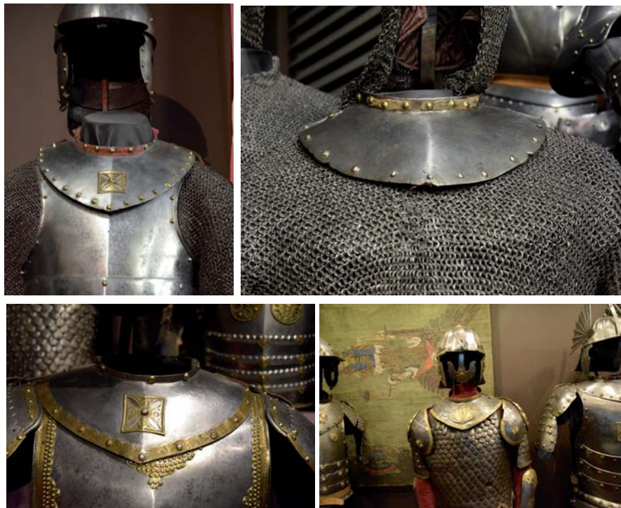
Foto 2. Obojczyki przy zbrojach husarskich, XVII/XVIII w., Muzeum Wojska Polskiego w Warszawie: MWP 34418*, MWP 335/9*, MWP 24326*, MWP 24321*, fot. Piotr M. Zalewski