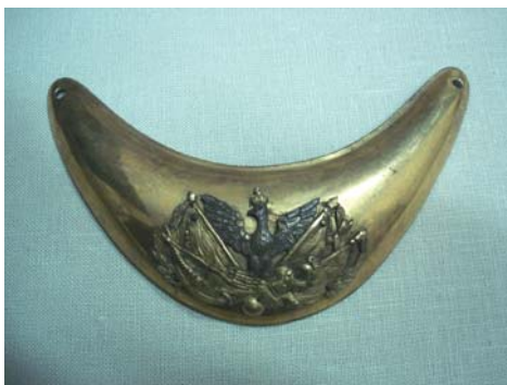
Foto 9. Ryngraf oficera wyższego Legii Nadwiślańskiej, 1809 r., Muzeum Narodowe w Krakowie, nr inw. V.4226