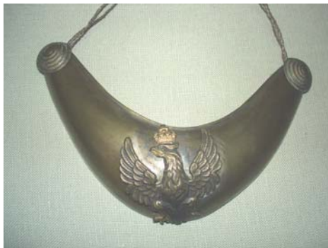
Foto 10. Ryngraf oficerski z okresu Królestwa Polskiego, Muzeum Narodowe w Krakowie, nr inw. V. 299