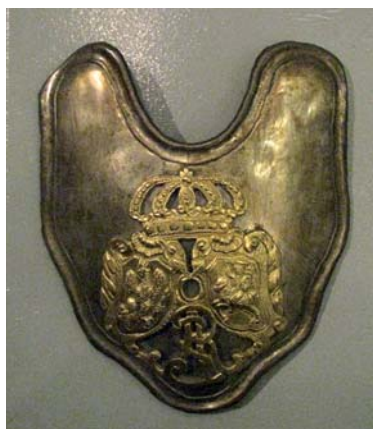
Foto 5a. Ryngraf oficerski z pierwszych lat panowania Stanisława Augusta Poniatowskiego, Muzeum Wojska Polskiego w Warszawie, nr inw. 24418 MWP