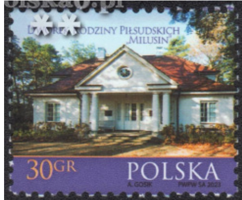
Znaczek o nominale 30 groszy polskich „Dworek rodziny Piłsudskich »Milusin«” z 2023 roku

Autorem projektu znaczka jest artysta Andrzej Gosik 7 , Muzeum Józefa Piłsudskiego w Sulejówku dostarczyło zdjęcie dworku autorstwa Piotra Ostrowskiego. Znaczek o wartości 30 groszy polskich wykonany został w technice druku rotograviury 8 , tj. odmianie druku wklęsłego na papierze fluorescencyjnym. Ma format 31,25 mm szerokości na 25,5 mm wysokości. W górnej części znaczka nadrukowana jest inskrypcja: DWOREK RODZINY PIŁSUDSKICH „MILUSIN”.