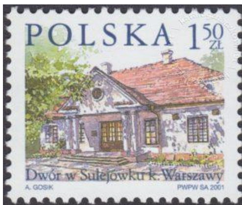
Znaczek o nominale 1,50 zł „Dwór w Sulejówku k. Warszawy” z 2001 roku